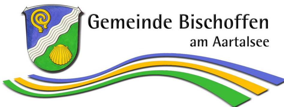
Abbildung 2: Gemeindelogo